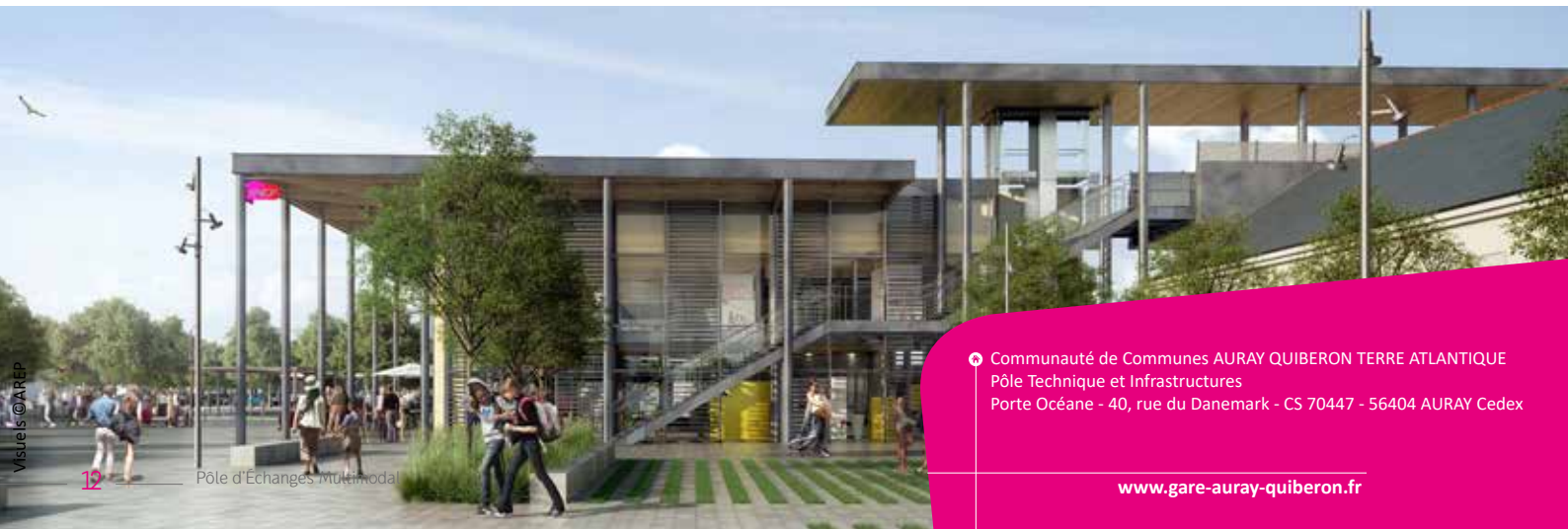
Pôle d'Echanges multimodal

Communauté de Communes AURAY QUIBERON TERRE ATLANTIQUE Pôle Technique et Infrastructures Porte Océane - 40, rue du Danemark - CS 70447 - 56404 AURAY Cedex