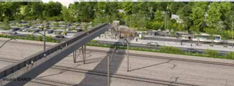
La future passerelle : lien entre le nord et le sud

Ce projet vise à améliorer l'accès aux différents modes de transports en développant un pôle de connexions complémentaires. C'est pourquoi, afin d'améliorer l'offre de transports collectifs, le projet intègre la construction d'une gare routière interurbaine de 8 quais pour les cars BreizhGo (ex TIM) et TER au sud, proche du bâtiment voyageurs et des connexions avec le réseau AurayBus. L'accès nord sera également équipé d'espaces dédiés aux transports collectifs. Un espace de co-voiturage est prévu, ainsi que des emplacements avec bornes de recharges pour véhicules électriques au nord comme au sud. Ces aménagements participent au développement des modes de transports alternatifs à la voiture, et s'inscrivent dans une réflexion globale de continuité des liaisons piétonnes et cyclables sur le territoire. (voir plan p5)